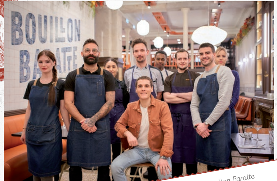
L'équipe de Bouillon Baratte